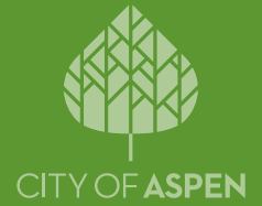
IMAGEN DEL PLAN DE ACCIÓN DE SOSTENIBILIDAD DE ASPEN